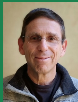
מורדי קרשנר | במאי ויוצר